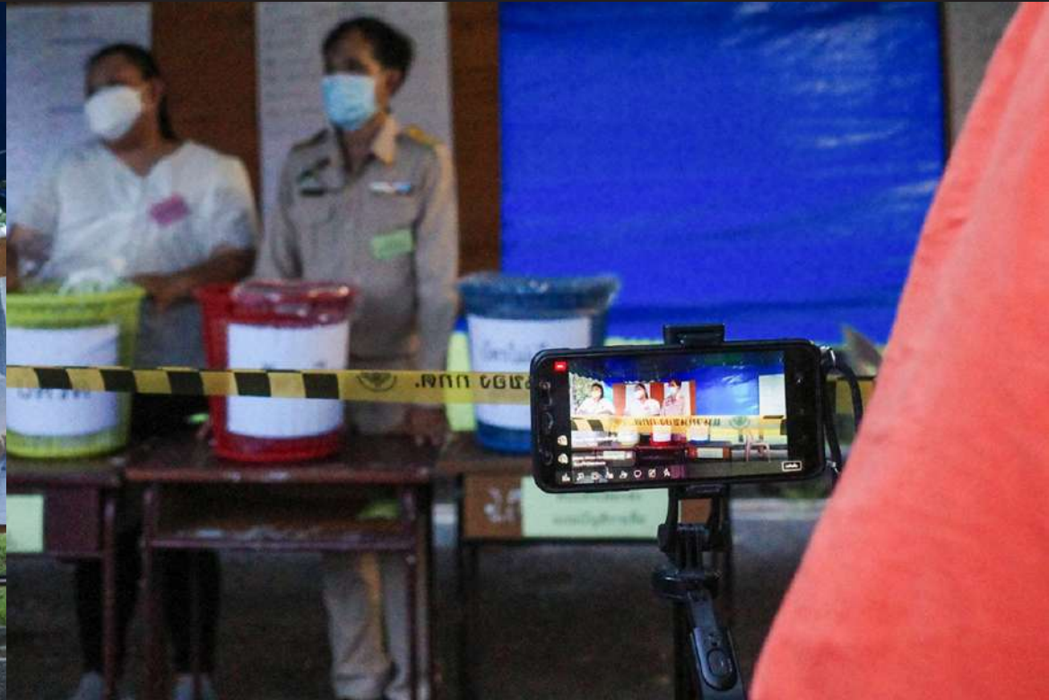
ภาพที่ 10 ประชาชนสตรีมีสติกการนับคะแนนในเฟซบุ๊กส่วนตัว