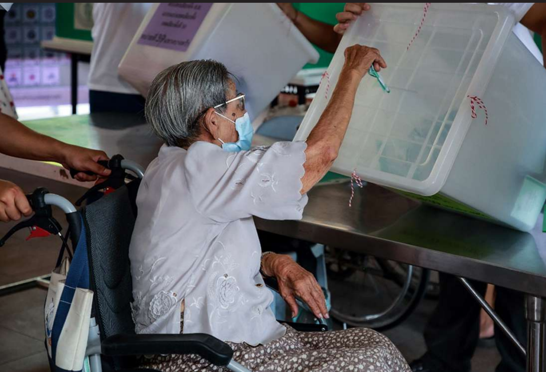
ภาพที่ 6 กรรมการประจำหน่วยเลือกตั้ง เป็นผู้อำนวยความสะดวกและให้ความช่วยเหลือในการออกเสียงลงคะแนนแก่ผู้สูงอายุ โดยให้คำนึงถึงความสะดวกในการออกเสียงลงคะแนน รวมทั้งการหย่อนบัตรลงในหีบบัตรเลือกตั้งแต่ละประเภทให้ถูกต้อง