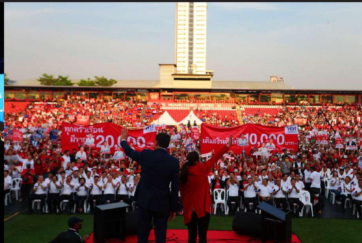
ภาพที่ 7 Pheu Thai Party launches representative party candidates for Prime Minister and party list of potential candidates for parliament at Thunder Dome Stadium, Muang Thong Thani.