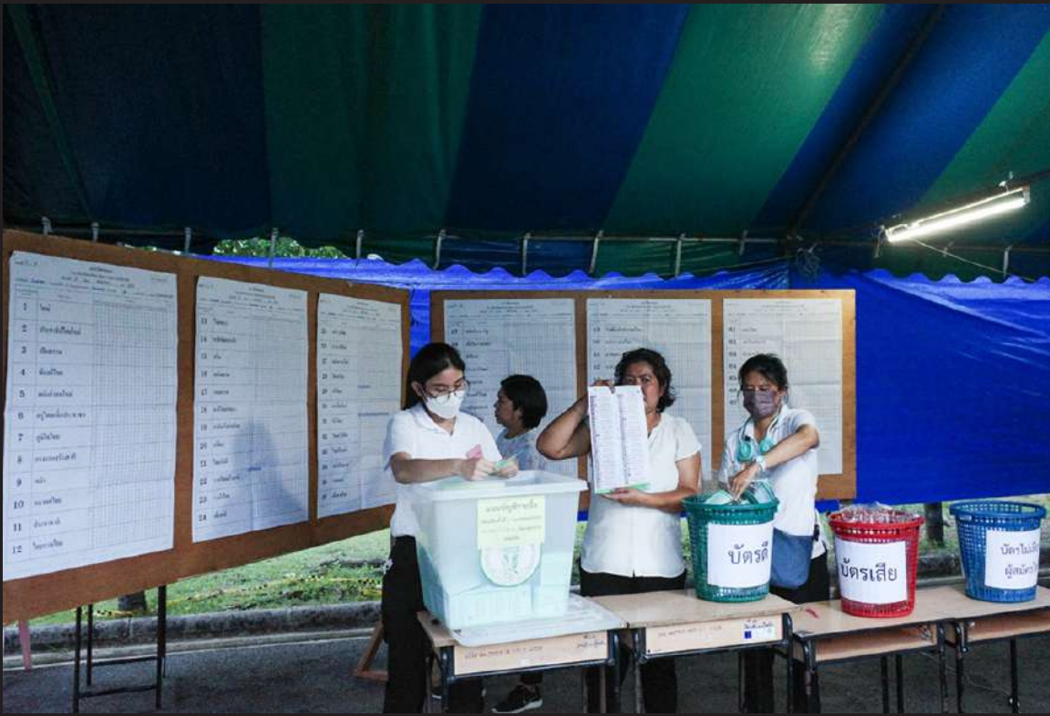
ภาพที่ 7 เจ้าหน้าที่แยกบัตรดี บัตรเสีย และบัตรไม่ประสงค์ลงคะแนน