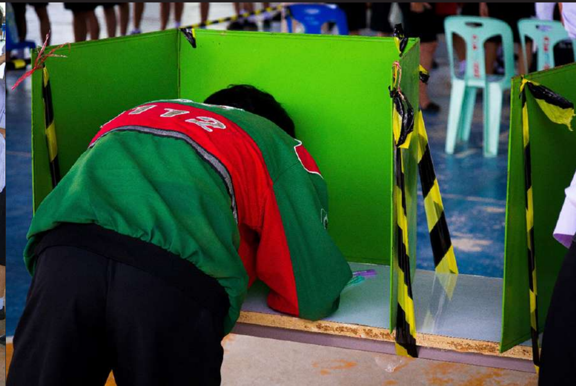
ภาพที่ 5 นักเรียนทุกคนจะได้รับบัตรเลือกตั้งและเข้าไปกาในคูหาเหมือนกับการเลือกตั้งระดับชาติ