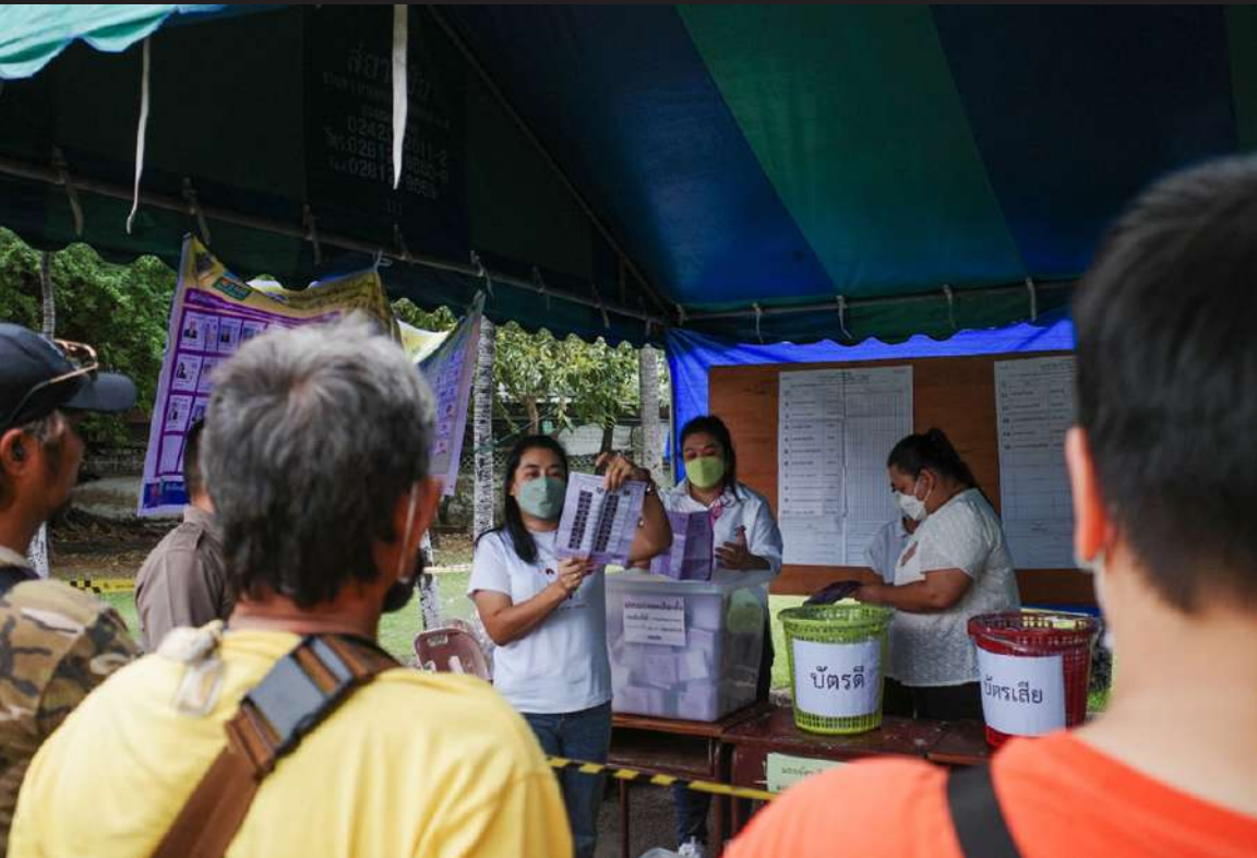
ภาพที่ 6 เจ้าหน้าที่ชำนาญหมายเลขที่กากบาทในขณะที่ประชาชนคอยตรวจสอบความถูกต้อง