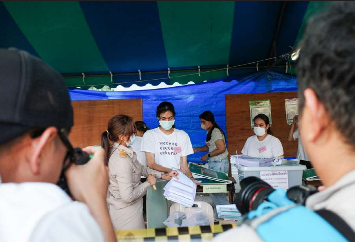
ภาพที่ 4 เจ้าหน้าที่แสดงให้เห็นความโปร่งใสในการปิดหีบเลือกตั้ง