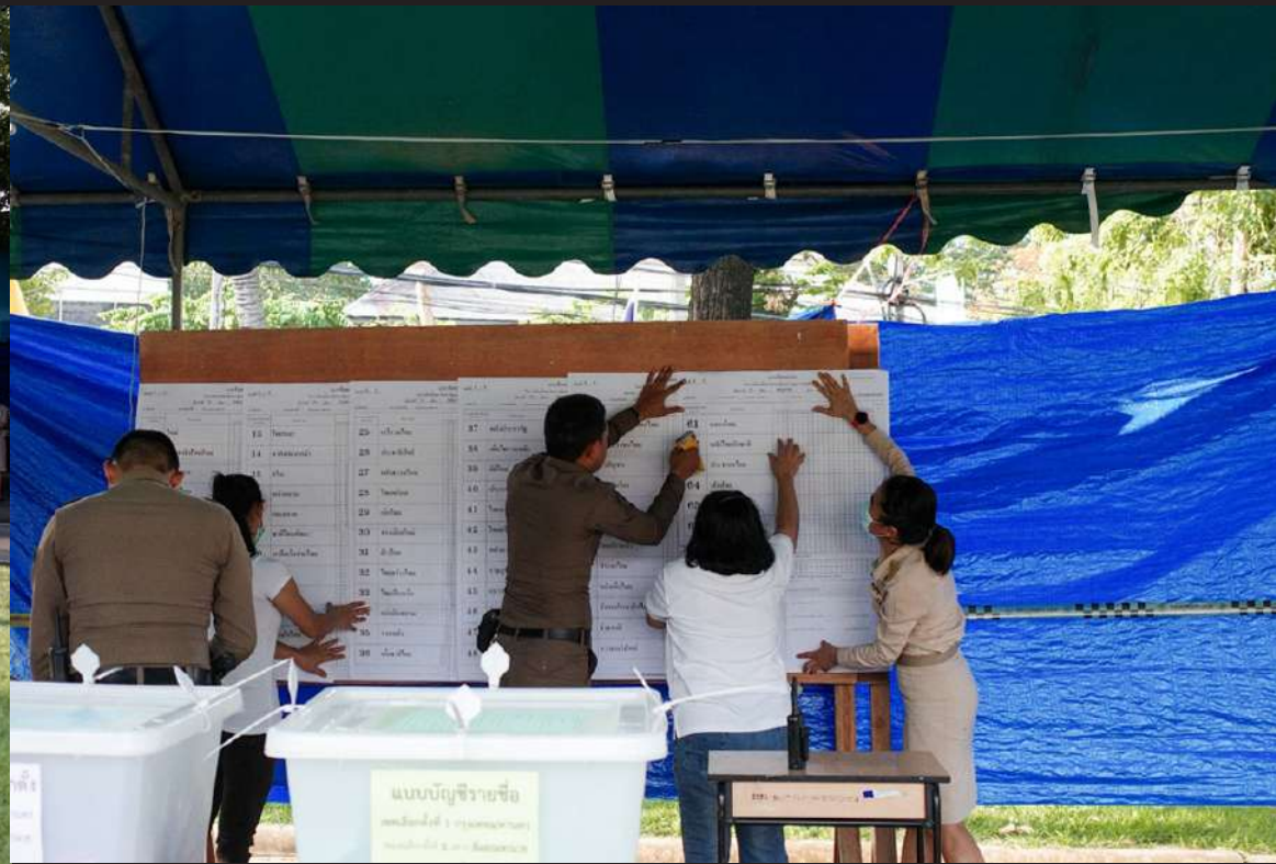
ภาพที่ 2 นักรอกการนับคะแนน หลังปิดหีบเลือกตั้ง