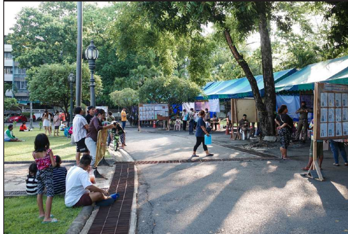
ภาพที่ 1 ผู้คนรวมตัวกันบริเวณรอบ ๆ หน่วยเลือกตั้ง ตั้งแต่ก่อนปิดหีบเลือกตั้ง

การตรวจสอบจากสาธารณชนระหว่างการนับคะแนนการเลือกตั้งเป็นกลไกสำคัญที่สร้างเสริมความโปร่งใสและความยุติธรรม นอกเหนือจากนี้ เป็นการช่วยตรวจจับความผิดปกติหรือข้อผิดพลาด เช่น การขีดคะแนนบนกระดานผลการนับบัตรดีเป็นบัตรเสีย เป็นต้น