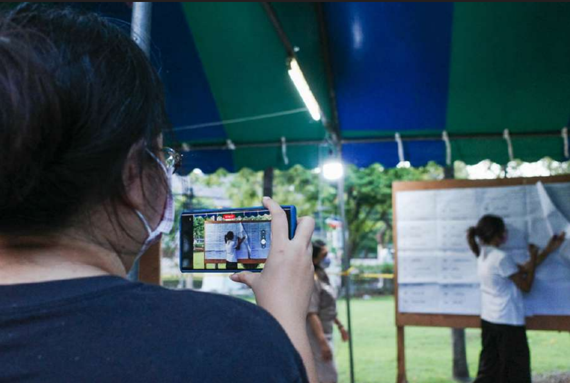
ภาพที่ 12 ประชาชนบันทึกวิดีโอเพื่อเป็นหลักฐาน สำหรับการตรวจสอบในภายหลัง