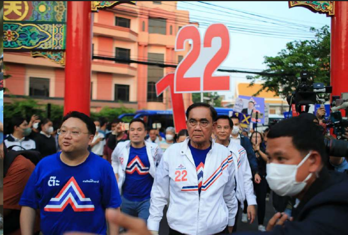
ภาพที่ 4 General Prayut Chan-o-cha and members of the Ruam Thai Sang Chart Party walk to meet people to campaign at Lumpini Park and at 6:00 pm continue to campaign on Yaowarat Road