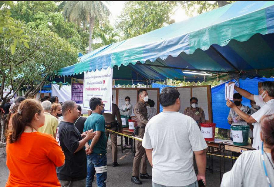
ภาพที่ 5 เริ่มนับคะแนน