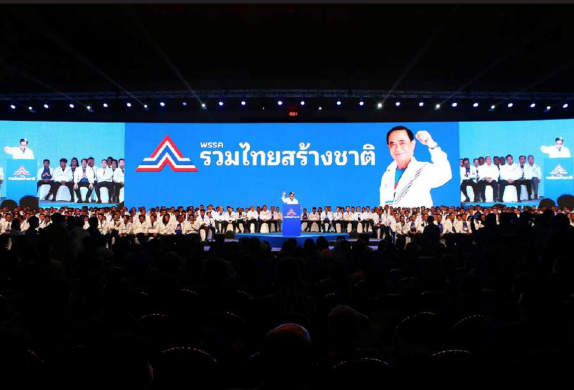
ภาพที่ 6 Ruam Thai Sang Chart Party launched political rally of all 400 candidates of parliamentary and candidates to be the prime minister on behalf of the Ruam Thai Sang Chart Party, General Prayut Chan-o-cha is the first candidate at Hall 5 Impact Arena, Muang Thong Thani