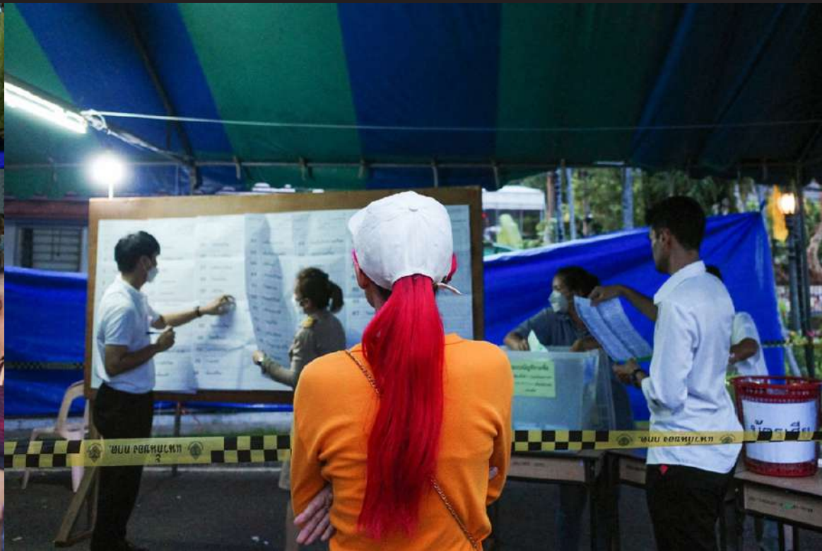
ภาพที่ 8 ประชาชนคอยตรวจสอบการนับคะแนนตรวจสอบความถูกต้อง