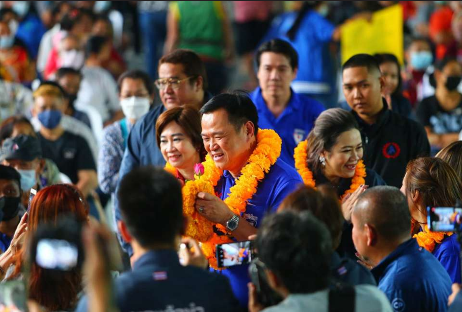
ภาพที่ 1 Bhumjaithai Party opens its first campaign speech in Bangkok for the upcoming general election. Ready to launch the candidate for Phaya Thai District Representative by Mr. Anutin, the leader of the Bhumjaithai Party.