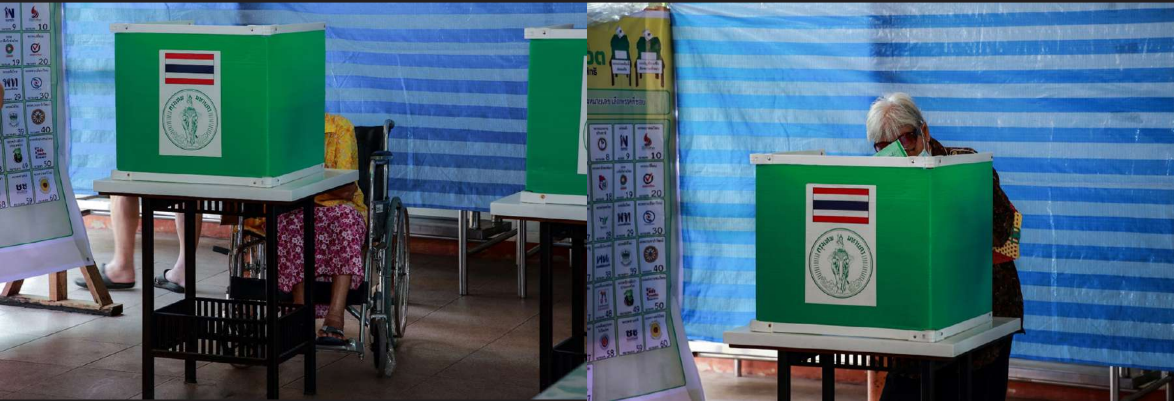
ภาพที่ 4 อำนวยความสะดวกและให้ความช่วยเหลือในการออกเสียงลงคะแนนแก่ผู้สูงอายุ ผู้ทุพพลภาพโดยให้คำนึงถึงความสะดวกในการออกเสียงลงคะแนน โดยจัดให้มีช่องทางให้รถวีลแชร์สามารถเข้า - ออกได้สะดวก จัดวางคูหาอยู่ห่างจากคูหาอื่นอย่างน้อย 1.50 เมตร ใต้รางคูหาออกเสียงลงคะแนนต้องมีความสูงไม่เกิน 0.75 เมตร