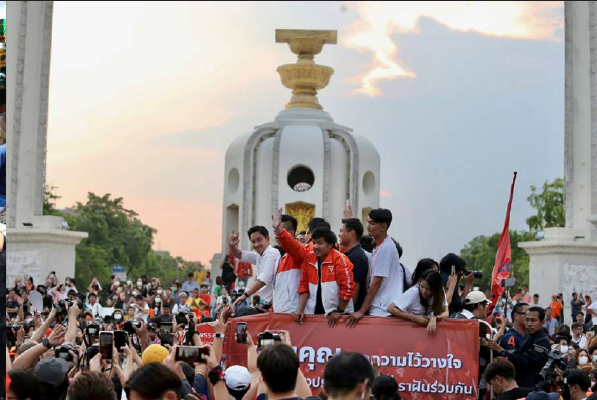
ภาพที่ 11 Move Forward Party walks to launch a candidates in Bangkok and election campaign policies based on the idea of good politics, good mouth, good future at Chatuchak Market