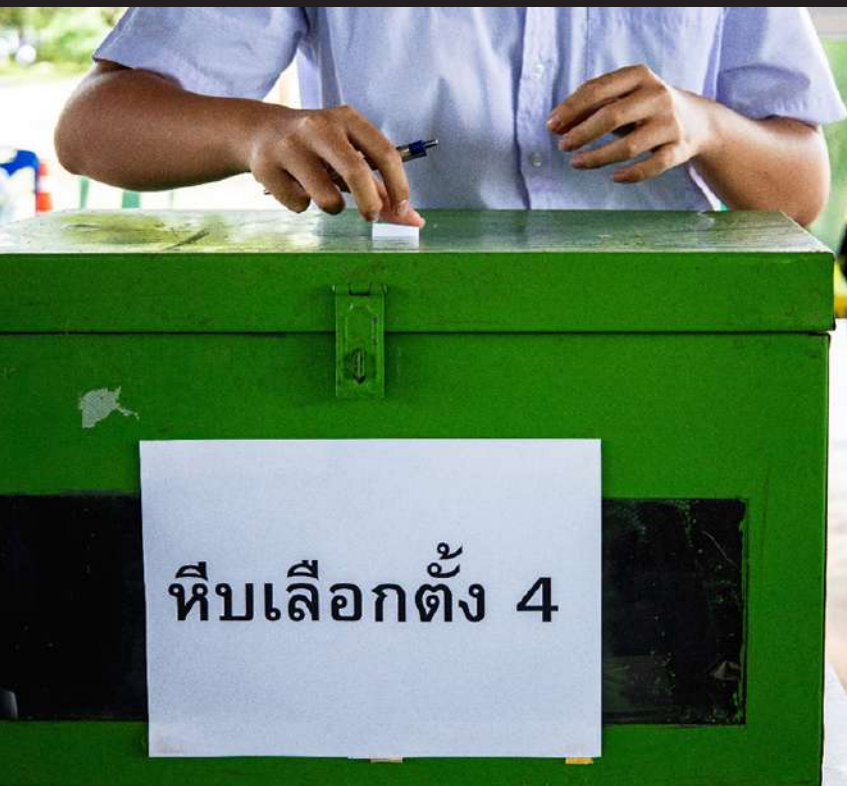
ภาพที่ 6 มีการแบ่งหน่วยเลือกตั้งออกเป็นหลายหน่วยเพื่อให้ใกล้เคียงกับการเลือกตั้งระดับชาติ