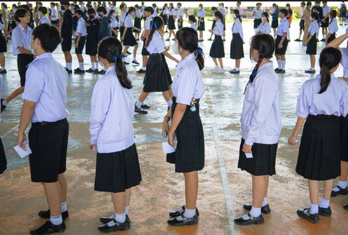
ภาพที่ 4 นักเรียนในสถานศึกษามาต่อแถวอย่างเป็นระเบียบเพื่อรอใช้สิทธิของตนเองอย่างคึกคัก