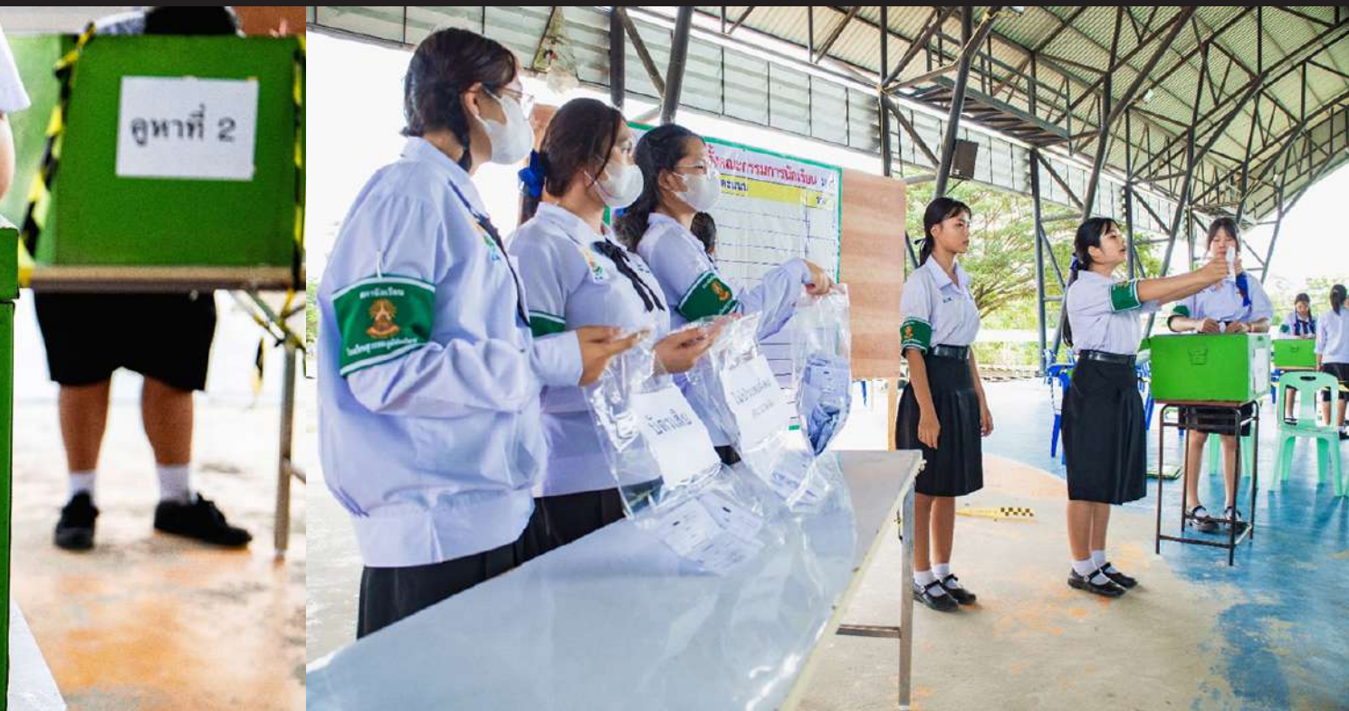
ภาพที่ 7 เมื่อหมดเวลาก็เริ่มการนับคะแนนอย่างโปร่งใส นักเรียนทุกคนสามารถเฝ้าสังเกตการณ์ได้หน้าหน่วยเลือกตั้ง