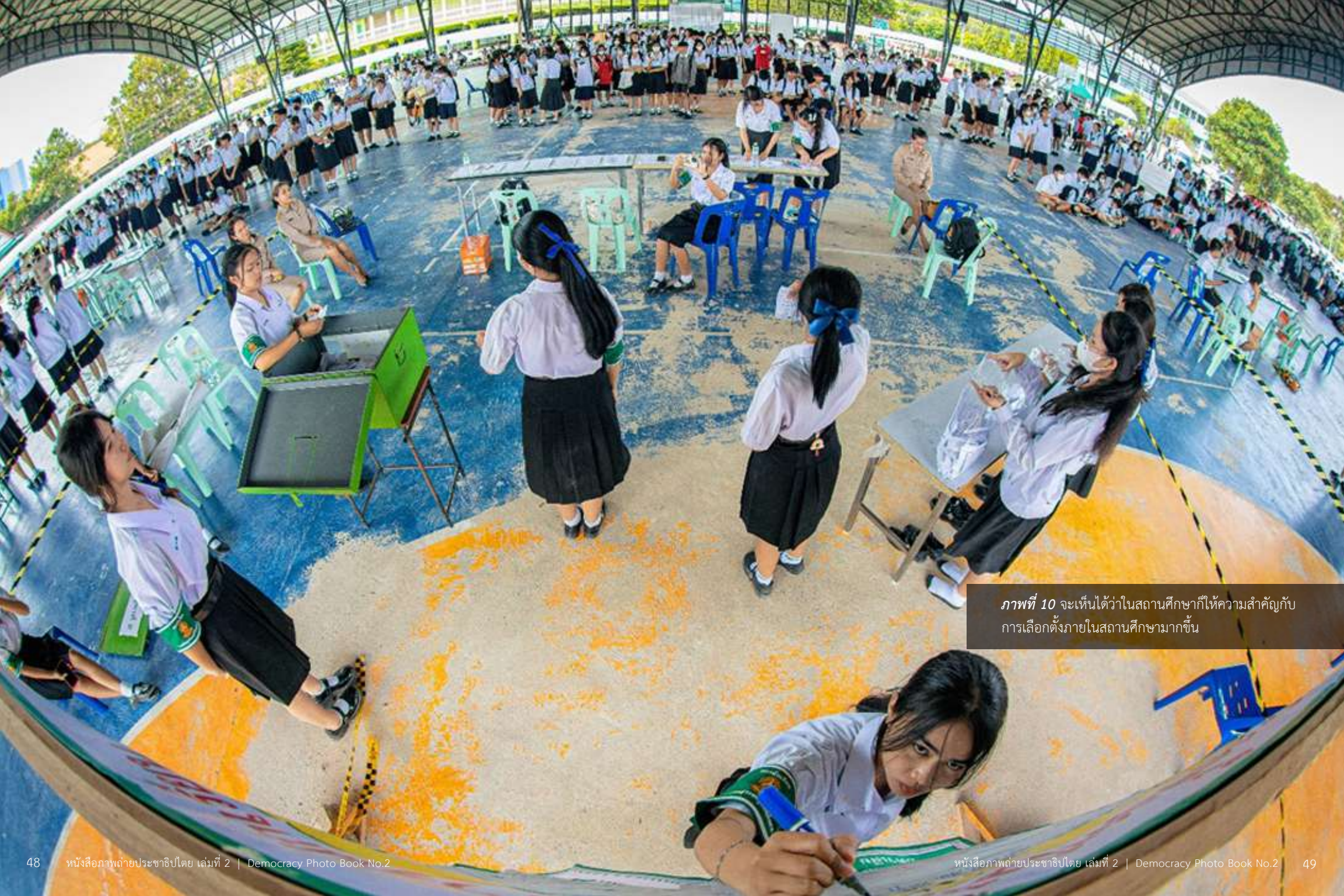
ภาพที่ 10 จะเห็นได้ว่าในสถานศึกษาก็ให้ความสำคัญกับการเลือกตั้งภายในสถานศึกษามากขึ้น