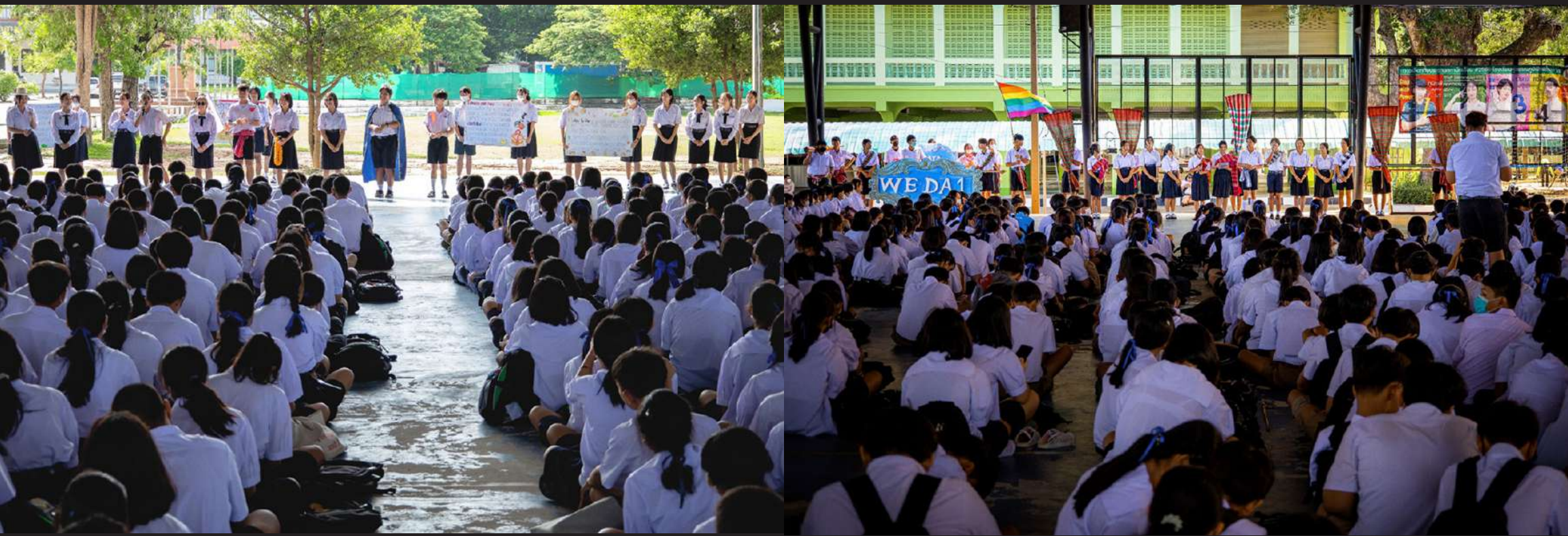
ภาพที่ 2 การหาเสียงของเยาวชนมีแนวทางที่สร้างสรรค์ขึ้น