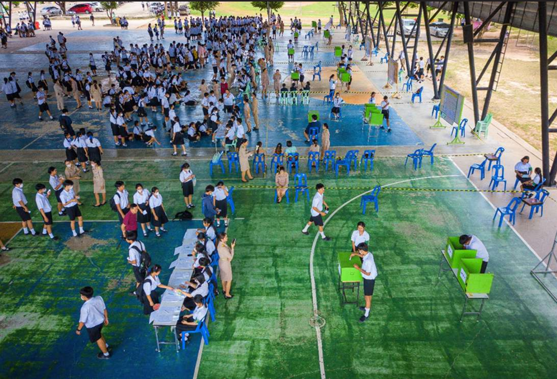
ภาพที่ 1 บรรยากาศของ การเลือกตั้งภายในสถานศึกษา ในปี พ.ศ.2566