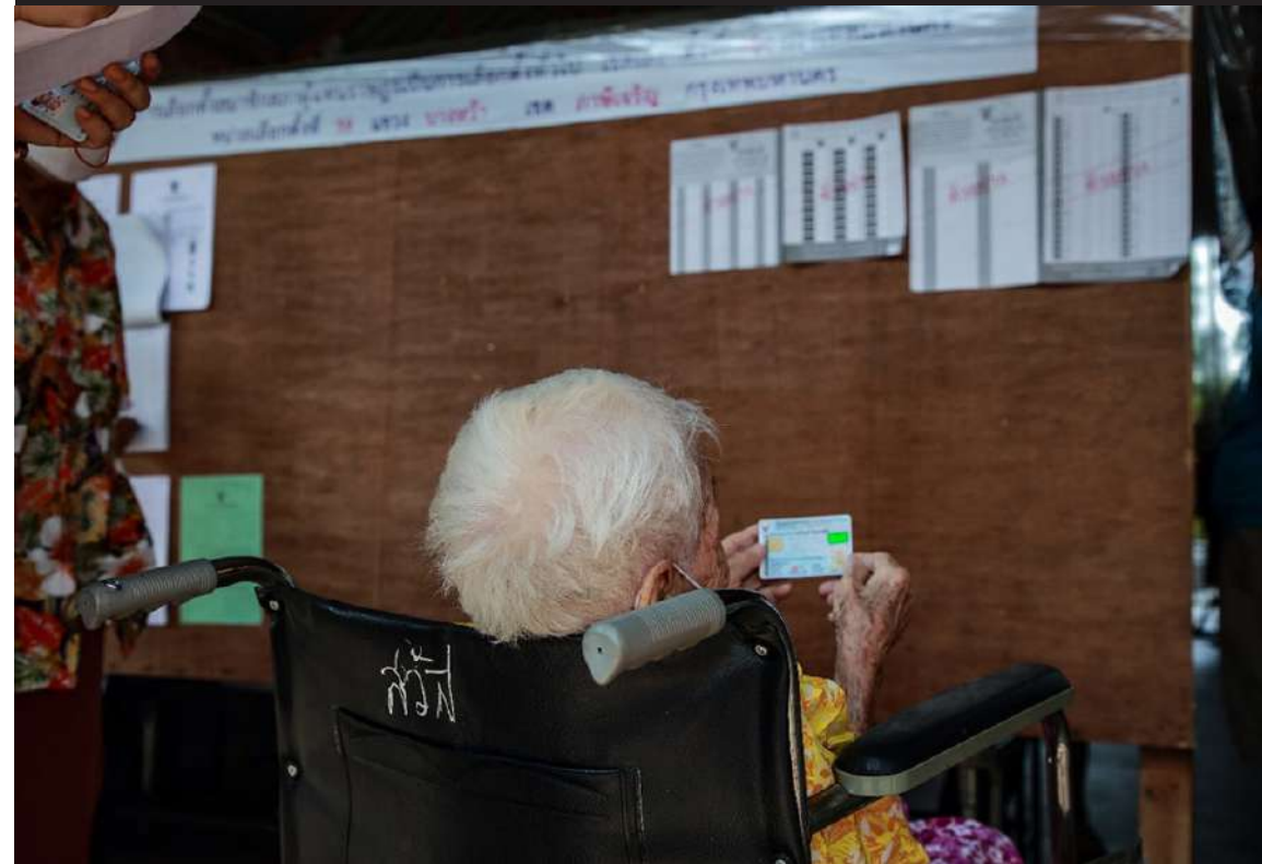
ภาพที่ 1 คุณยายท่านนี้ชู้บัตรประจำตัวประชาชน แสดงถึงความพร้อมในการเข้าคูหาเลือกตั้งอย่างเต็มที่ หลายพรรคการเมืองให้ความสำคัญกับนโยบายเพื่อผู้สูงอายุมากขึ้น ผู้สูงอายุเองจำเป็นต้องศึกษาและตั้งหลักก่อนเข้าคูหาเลือกตั้ง

นโยบายผู้สูงอายุ เป็นงานด้านสังคม เป็นจุดสำคัญในการดูแลคุณภาพชีวิตของคนไทยหลังวัยเกษียณ เป็นงานที่ยากและเห็นผลช้า ต้องอาศัยความจริงใจจากพรรคการเมืองในการแก้ไขปัญหาอย่างต่อเนื่อง เพื่อให้ “ผู้สูงอายุ” สามารถดำรงชีพอยู่ได้ด้วยศักดิ์ศรีความเป็นมนุษย์อย่างเสมอภาค