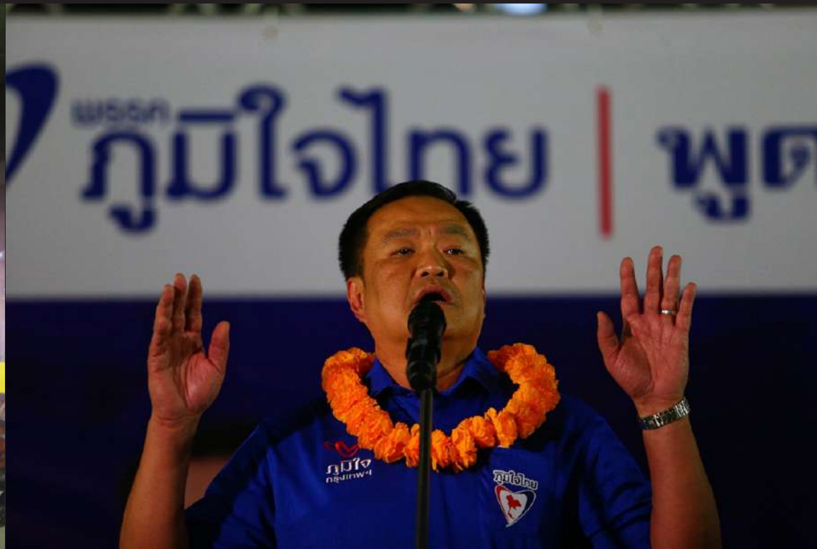
ภาพที่ 2 Bhumjaithai Party opens its first campaign speech in Bangkok for the upcoming general election. Ready to launch the candidate for Phaya Thai District Representative by Mr. Anutin, the leader of the Bhumjaithai Party.