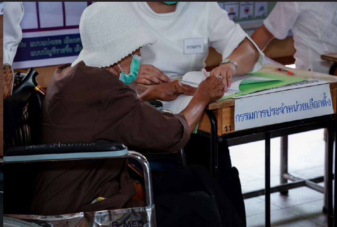
ภาพที่ 12 คุณยายท่านนี้มาตรวจสอบรายชื่อ เข้าคูหาเลือกตั้งพร้อมกับแมวคู่มือ หลังจากเสร็จจากการขายของที่ตลาดเช้าซึ่งอยู่ใกล้กับหน่วยเลือกตั้ง