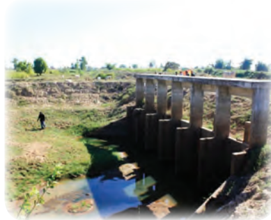
นำไปสู่การสร้างคันกันน้ำเพื่อป้องกันน้ำท่วม แต่ไม่ประสบความสำเร็จอย่างที่ตั้งใจ