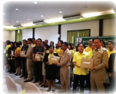
ผู้ว่าราชการจังหวัดรับนโยบายแผนเจ้าเมือง เพื่อดำเนินการต่อ