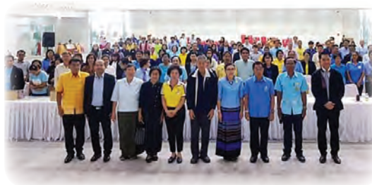
สู่การขยายผลให้ความรู้สู่หน่วยงานระดับจังหวัด และกำหนดแผนการดำเนินงานแก้ไขปัญหาาร่วมกัน