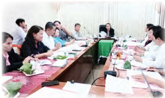
คณะกรรมการศูนย์ฯ จังหวัดเลยเข้าร่วมหารือ และวางแผน การดำเนินงานเชิงรุกกับกระทรวงการศึกษา

โดยศูนย์พัฒนาการเมืองภาคพลเมือง สถาบันพระปกเกล้า จังหวัดเลย