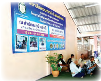
สร้างจุดร่วม สงวนจุดต่าง ผ่านการแสดงศิลปะ วัฒนธรรม

โดยศูนย์พัฒนาการเมืองภาคพลเมือง สถาบันพระปกเกล้า จังหวัดปัตตานี