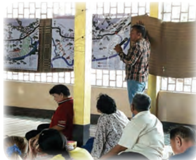
นำมาซึ่งการสำรวจเส้นทางสายน้ำ และวางแผนการดำเนินการแก้ปัญหาต่อไป