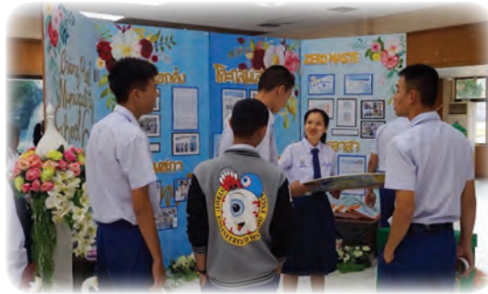
การสร้างเครือข่ายผ่าน กลุ่มเยาวชน นักเรียน/นักศึกษา ในโรงเรียน

โดยศูนย์พัฒนาการเมืองภาคพลเมือง สถาบันพระปกเกล้า จังหวัดเชียงราย