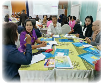
ผู้การอบรม และเรียนรู้ร่วมกัน