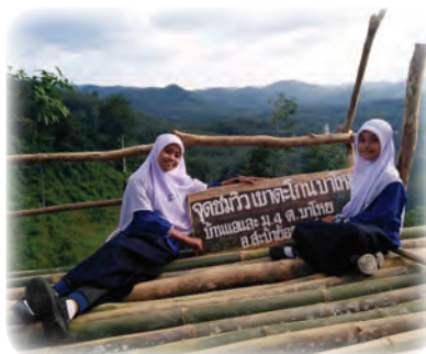
ส่งเสริมเศรษฐกิจในชุมชน ผ่านการท่องเที่ยวเชิงธรรมชาติ