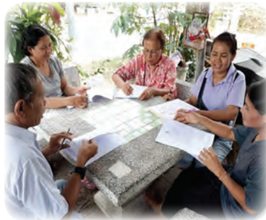
ลงมือปฏิบัติ เริ่มจากการลงพื้นที่เก็บข้อมูลรวบรวม และวิเคราะห์ปัญหา พร้อมกำหนดเป็นนโยบายเพื่อส่งมอบต่อผู้มีอำนาจ