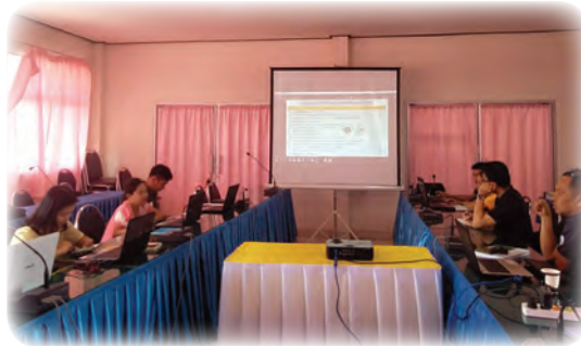
การร่วมปรึกษารื้อกับภาคีเครือข่ายน่านจัดการตนเอง และภาคีเครือข่ายอื่น ๆ ที่เกี่ยวข้อง

โดยศูนย์พัฒนาการเมืองภาคพลเมืองสถาบันพระปกเกล้า จังหวัดน่าน