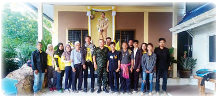
โดยได้รับความร่วมมือ และการสนับสนุนจากหน่วยงานหลายภาคส่วนของรัฐ