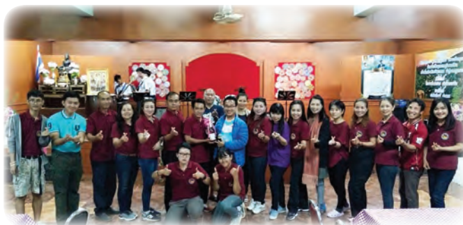
จนเกิดเป็นความร่วมมือจากหน่วยงานทุกภาคส่วนของจังหวัดเชียงราย