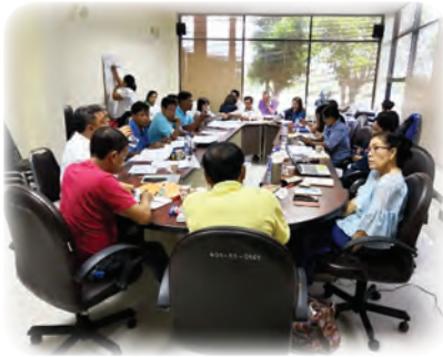
คณะกรรมการศูนย์ฯ เข้าร่วมพูดคุย และพบปะหน่วยงานที่เกี่ยวข้อง

โดยศูนย์พัฒนาการเมืองภาคพลเมืองสถาบันพระปกเกล้า จังหวัดสุพรรณบุรี