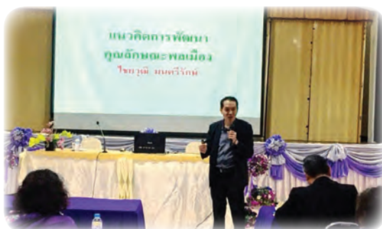
และให้ความรู้คุณลักษณะพลเมืองแก่บุคลากร ภาครัฐ เอกชน และประชาชน จังหวัดเลย