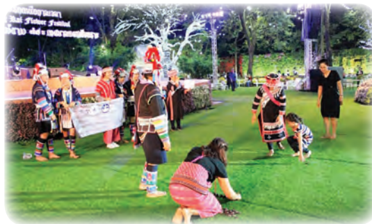
รณรงค์ให้ชุมชนมีส่วนร่วมในด้านวัฒนธรรม