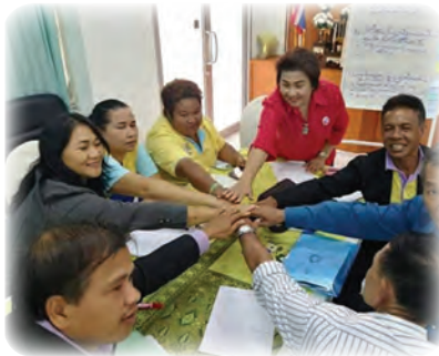
เกิดเป็นพลังพลเมือง จังหวัดนครศรีธรรมราชทุกอำเภอ