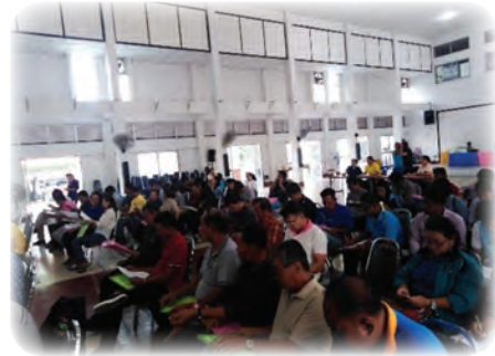
จัดอบรมให้ความรู้กับชุมชนทุกระดับ