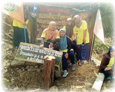
พัฒนาท้องถิ่นให้เป็นการจัดตลาดนัดขายสินค้า ชุมชนและแหล่งเรียนรู้ของชุมชน