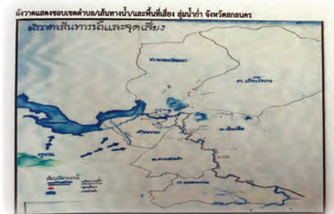
และออกเป็นแผนที่ชุมชน กำหนดทิศทางสายน้ำได้สำเร็จ