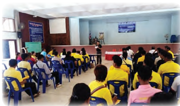
สุพื้นที่การทดลองปฏิบัติจริงในชุมชน