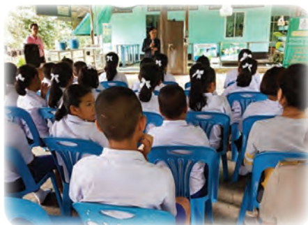
ขยายผลการให้ความรู้สู่กลุ่มนักเรียน ในฐานะเยาวชนของชาติในอนาคต