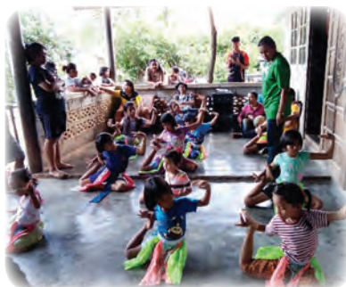
สร้างจุดร่วม สงวนจุดต่าง ผ่านการแสดงศิลปะ วัฒนธรรม ท้องถิ่น(การรำมะโนรา)