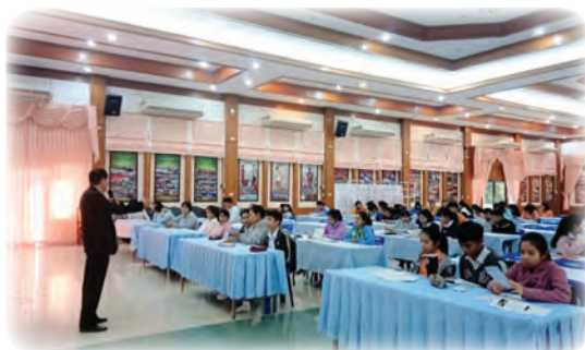
สู่การปลูกฝังให้ควมรู้กับนักเรียน