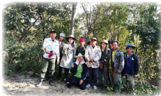
ลงพื้นที่สำรวจพิกัดจุด GPs ของจังหวัดน่าน