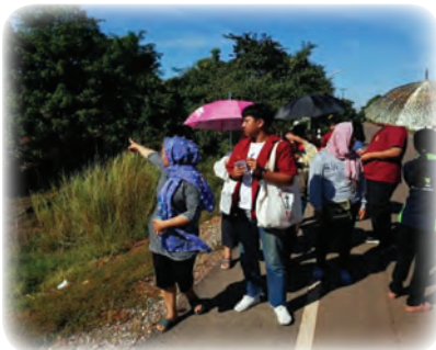
เมื่อคันกันน้ำไม่สามารถกันน้ำได้ การลงพื้นที่สำรวจ ปัญหาจึงเกิดขึ้นโดยกลุ่มชาวบ้านที่เดือดร้อน