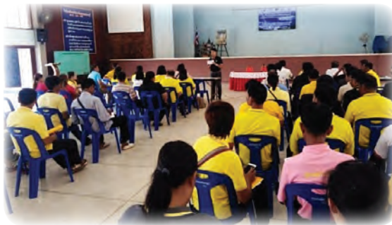
ขยายผลให้ความรู้อย่างต่อเนื่องและเข้มข้น