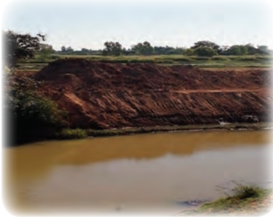
พื้นที่สายน้ำของจังหวัดสกลนคร เมื่อฝนตก น้ำจะท่วม เมื่อถึงหน้าแล้งน้ำจะแห้งจนไม่เหลือ

โดยศูนย์พัฒนาการเมืองภาคพลเมือง สถาบันพระปกเกล้า จังหวัดสกลนคร