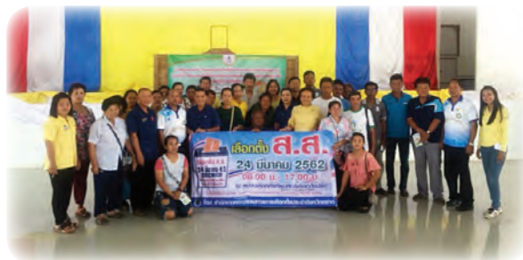
จนเกิดเป็นความสำเร็จ ที่มีจากความร่วมมือของทุกฝ่ายอย่างแท้จริง