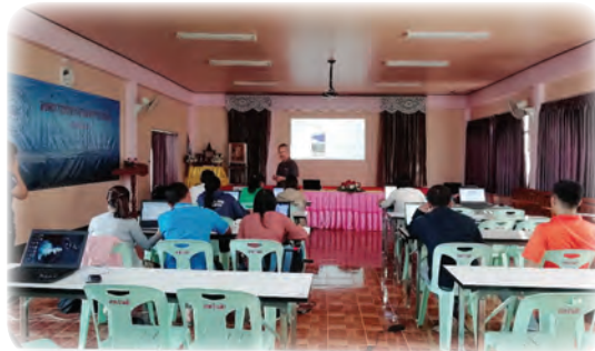
วางแผนการดำเนินงานร่วมกันในเรื่องของการใช้เทคโนโลยี GPS