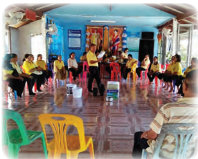
การลงพื้นที่ให้ความรู้กับชุมชนเรื่องของขยะ ทั้งที่เป็นพิษและไม่เป็นพิษต่อสิ่งแวดล้อม

โดยศูนย์พัฒนาการเมืองภาคพลเมืองสถาบันพระปกเกล้า จังหวัดตราด