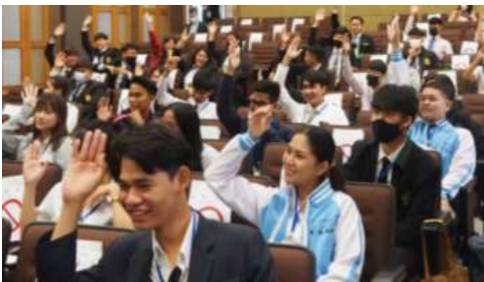
รูปแบบการจัดแบบ on site

เพื่อบรรลุวัตถุประสงค์ของโครงการ สำนักส่งเสริมการเมืองภาคพลเมือง จึงออกแบบกระบวนการฝึกอบรมในลักษณะค่ายเยาวชน เปิดพื้นที่ให้เยาวชนได้แลกเปลี่ยนเรียนรู้ร่วมกันแบบพบหน้าในสถานที่เดียวกัน ที่เรียกว่า การฝึกอบรมแบบ on site ทั้งนี้ในปี 2564 สำนักฯ ได้กำหนดจัดการฝึกอบรมรุ่นที่ 8 ตามรูปแบบปกติระหว่างวันที่ 30 พฤษภาคม-6 มิถุนายน 2564 แต่ด้วยสถานการณ์ความรุนแรงของโรคโควิด-19 มีผู้ติดเชื้อเพิ่มขึ้นอย่างต่อเนื่อง ทำให้มหาวิทยาลัยกลุ่มเป้าหมายที่กระจายในทุกภูมิภาคตัดสินใจไม่ส่งนิสิตนักศึกษาเข้าร่วมโครงการตามกำหนดการที่วางไว้ข้างต้น สำนักฯ จึงปรับเปลี่ยนรูปแบบและวิธีการฝึกอบรมเป็นแบบ online และยังคงเนื้อหาวิชาตามหลักสูตร แต่นำเทคโนโลยีและเครื่องมืออิเล็กทรอนิกส์มาใช้ดำเนินการฝึกอบรมให้สำเร็จ บรรลุเป้าหมายและตัวชี้วัดที่กำหนดไว้ โดยดำเนินการจัดฝึกอบรมหลักสูตร online ผ่านแอปพลิเคชัน Zoom ระหว่างวันที่ 4-20 กันยายน 2564