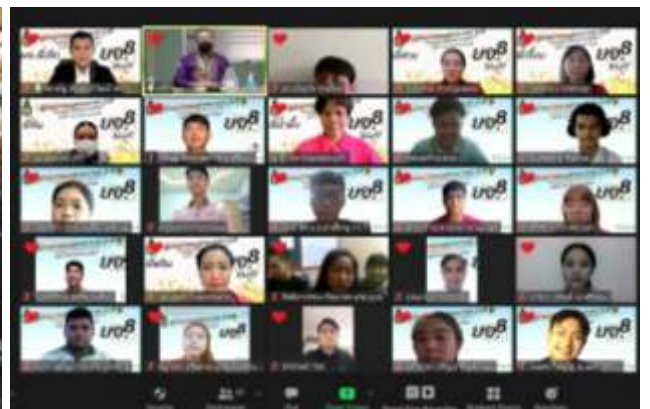
รูปแบบการจัดแบบ online