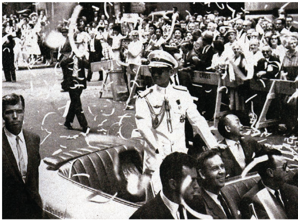
วันที่ ๑๔ มิถุนายน - ๑๔ กรกฎาคม ๒๕๐๓ เสด็จฯ เยือนประเทศสหรัฐอเมริกาอย่างเป็นทางการ