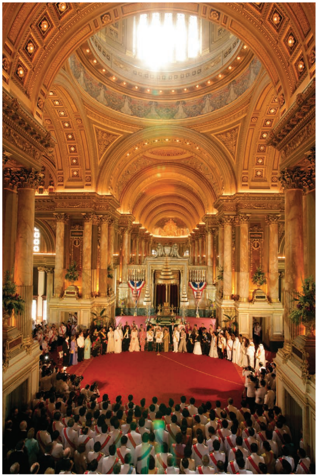
วันที่ ๑๒ มิถุนายน ๒๕๔๙ ในศุภวาระที่พระบาทสมเด็จพระปรมินทรมหาภูมิพลอดุลยเดช บรมนาถบพิตร เสด็จเถลิงถวัลยราชสมบัติ ครบ ๖๐ ปี ณ พระที่นั่งอนันตสมาคม