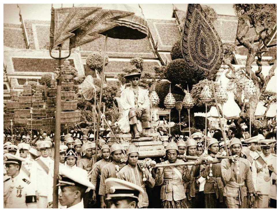
วันที่ ๕ พฤษภาคม ๒๔๙๓ พระราชพิธีบรมราชาภิเษก