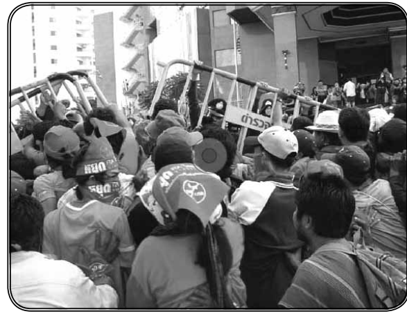
ภาพที่ 7 และ ภาพที่ 8 ประชาชนประท้วงนโยบายเขตการค้าเสรี (Free Trade Area) ที่เชียงใหม่ ประเทศไทย