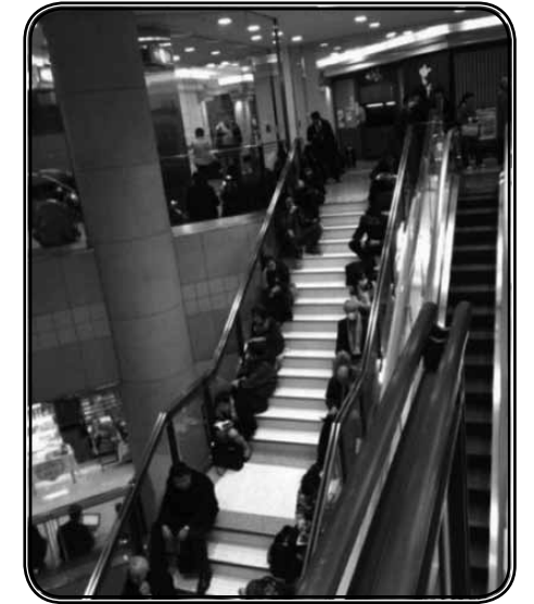
ภาพที่ 5 และ ภาพที่ 6 ชาวญี่ปุ่นที่ประสบภัย หลังเหตุการณ์สึนามิ ที่ตู้โทรศัพท์ และบริเวณรถไฟใต้ดิน