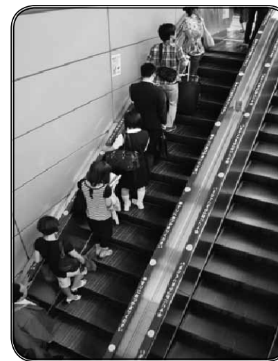
ภาพที่ 5 การขึ้นบันไดเลื่อน ในประเทศฮ่องกง