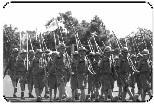
ภาพที่ 10 ลูกเสือฝึกภาคสนาม