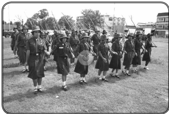
ภาพที่ 9 เนตรนารีฝึกภาคสนาม