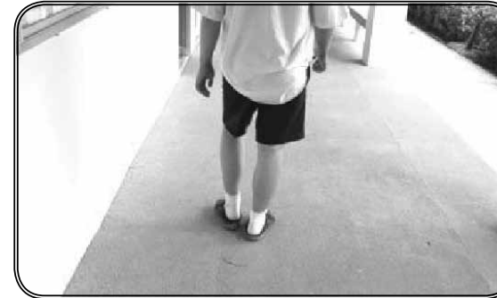
ภาพที่ 1 การสวมรองเท้าของนักเรียน

ให้นักเรียนแบ่งกลุ่มทำงานร่วมกัน และวิเคราะห์ภาพ ผู้ที่อยู่ในเหตุการณ์นั้นว่าได้ให้ความสำคัญกับคุณค่าใด และ นำเสนอเพื่อแลกเปลี่ยนความคิดเห็นในชั้นห้องเรียน