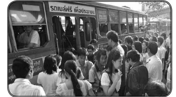
ภาพที่ 2 ประชาชนขึ้น-ลงรถเมล์ในกรุงเทพมหานคร