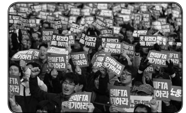
ภาพที่ 6 ประชาชนประท้วงนโยบายเขตการค้าเสรี (Free Trade Area) ในกรุงโซล ประเทศเกาหลีใต้