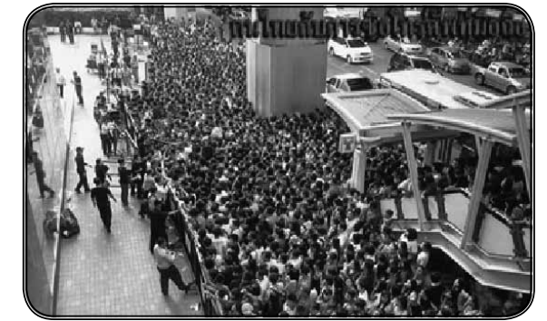
ภาพที่ 4 ประชาชนรอซื้อโทรศัพท์รุ่นใหม่ หน้าห้างสรรพสินค้า ในกรุงเทพมหานคร