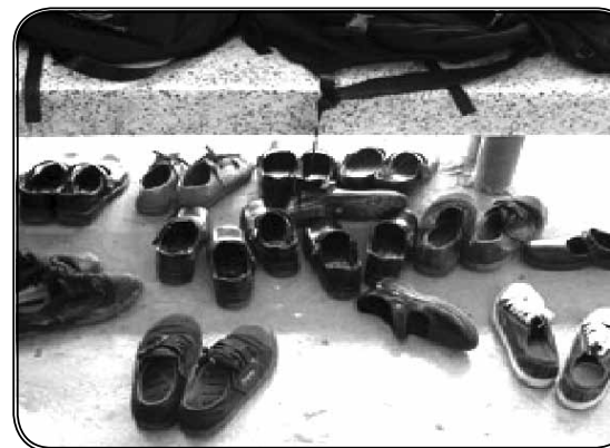
ภาพที่ 2 รองเท้าของนักเรียนที่ถอดไว้หน้าห้องเรียน