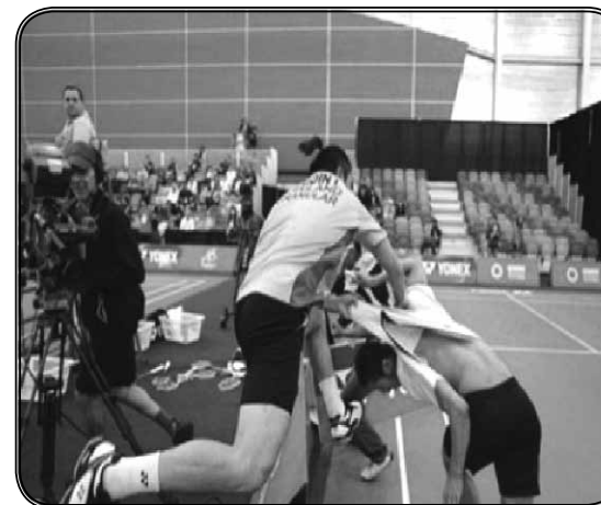
ภาพที่ 1 นักกีฬาในสนาม

ให้นักเรียนพิจารณาภาพต่อไปนี้ และตอบคำถามว่า สิ่งที่เกิดขึ้นในภาพส่งผลกระทบอะไรบ้าง ขอให้ให้นักเรียนใช้ตารางช่วยคิดหน้า 52 เพื่อตอบคำถาม