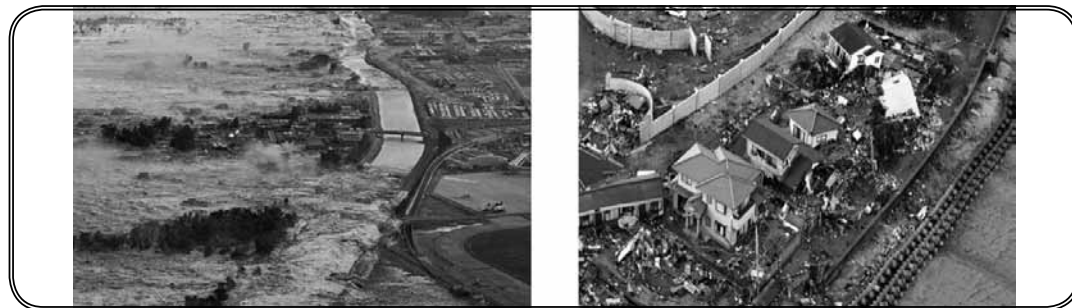
ภาพที่ 1 และ ภาพที่ 2 แสดงเหตุการณ์สึนามิ ที่ประเทศญี่ปุ่นเมื่อวันที่ 11 มีนาคม 2011