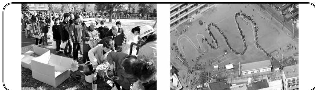
ภาพที่ 3 และ ภาพที่ 4 ชาวญี่ปุ่นที่ประสบภัย หลังเหตุการณ์สึนามิ