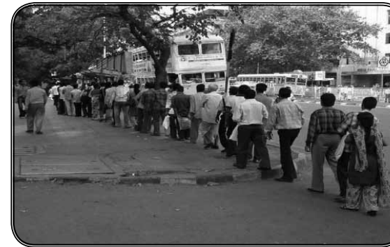
ภาพที่ 3 ประชาชนชาวอินเดียขึ้นรถเมล์