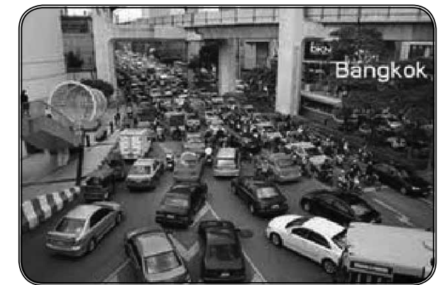
ภาพที่ 3 การจราจรบนท้องถนน